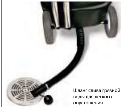
Шланг слива грязной воды для легкого опустошения