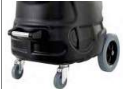
Прорезиненные колеса обеспечивают максимально тихое перемещение.